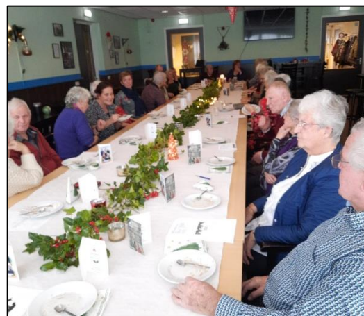
Ouderochtenden in De Beijer